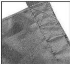
Pokryty miękką bawełną