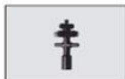
S5-09 Podstawa trzpienia