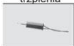
S5-13B Silnik B