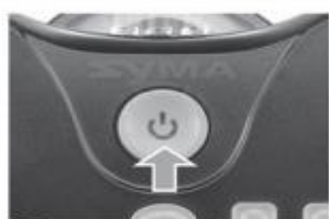
Krok 1: Wciśnij włącznik i uruchom kontroler.