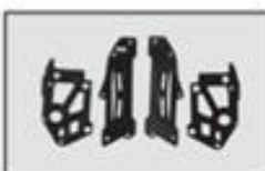
S5-12 Mocowanie kadłuba