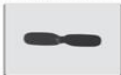
S5-03B Śmigło ogona