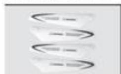
S5-03A Główne śmigło