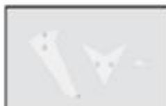
S5-02A Lotka ogona biała