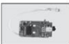
S5-15 Płytki odbiornika