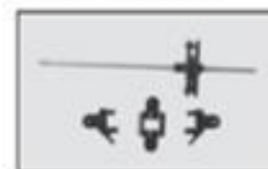
S5-08 Mocowanie śmigła