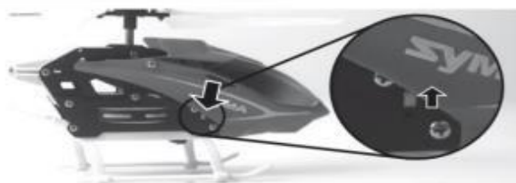
Krok 2: Uruchom śmigłowiec