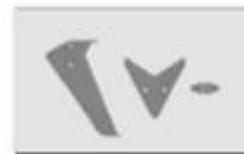
S5-02B Lotka ogona czerw.