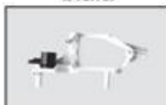
S5-04 Rama gł.