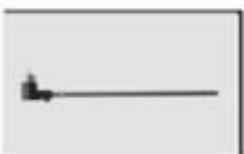
S5-11 Mocowanie ogona